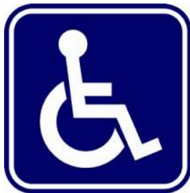
สัญลักษณ์คนพิการ

การขึ้นทะเบียนรับเงินเบี้ยยังชีพผู้ป่วยเอดส์